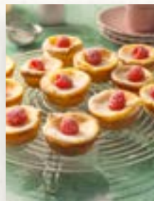
Schnelle Natas, Seite 41