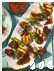
Vegane Spieße, Seite 27