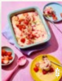
Erdbeer-Parfait, Seite 57