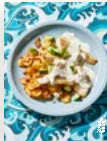
Pannfisch, Seite 58