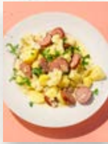
Blumenkohlentopf, Seite 45