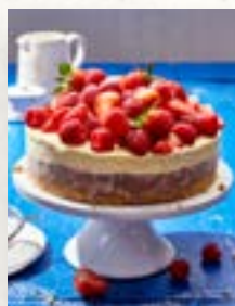
Easy Eistorte, Seite 31