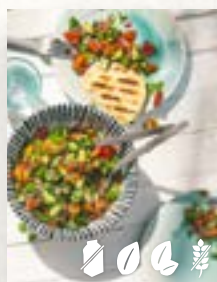
Tomaten-Gurken-Salat, Seite 26