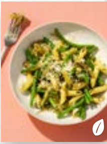
Bohnen-Pasta, Seite 44