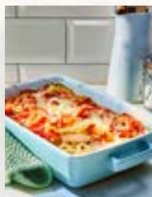
Schnitzel-Auflauf, Seite 32