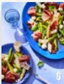
Spargelsalat, Seite 9