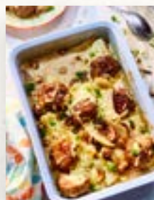
Buletten-Auflauf, Seite 33