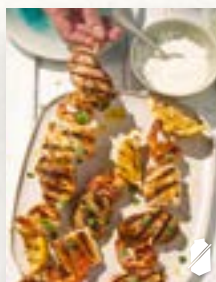
Surf-and-Turf-Spieße, Seite 29