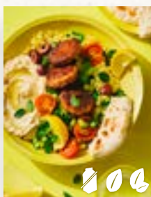
Hummus-Bowl, Seite 21