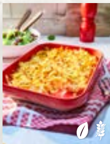
Rösti-Auflauf, Seite 35