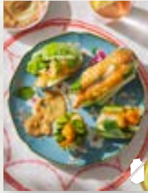
Crispy Garnelenrollen, Seite 50