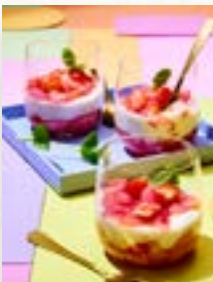
Rhabarber-Grütze, Seite 56