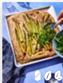
Spargel-Focaccia, Seite 13