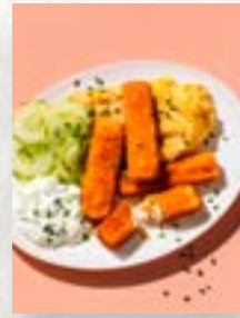
Fischstäbchen mit Rührei, Seite 47