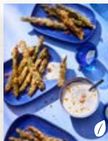
Knusper-Spargel, Seite 11