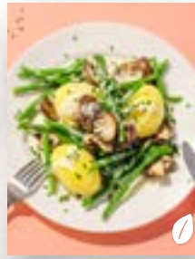
Bohnen-Pilz-Rahm, Seite 46