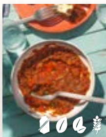
Paprika-Chili-Dip, Seite 28