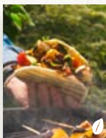
Gegrilltes Pitabrot, Seite 25