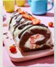
Erdbeer-Biskuitrolle, Seite 54