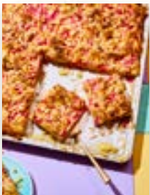
Rhabarberkuchen, Seite 55