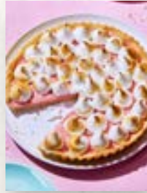
Rhabarber-Baiser-Tarte, Seite 52