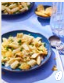
Spargel-Pasta, Seite 8

Jeden Tag neue Ideen: Freu dich auf 39 Rezepte für drinnen und draußen! Noch viele weitere Rezepte und Ideen findest du auch bei uns im Web oder auf Facebook, TikTok, Instagram & Co. Entdecke dort neue Trends und lass dich von unseren Koch- und Ernährungsexpert:innen inspirieren.