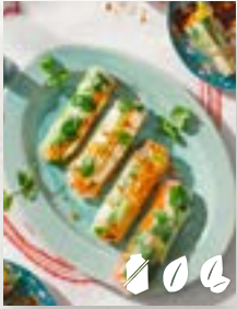
Gemüserollen, Seite 48