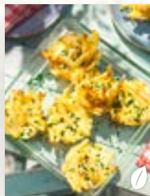
Makkaroni-Happen, Seite 39