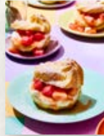
Windbeutel, Seite 53