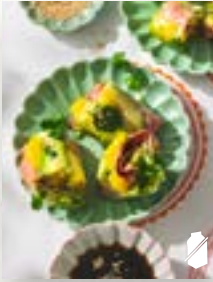
Pastramirollen, Seite 49