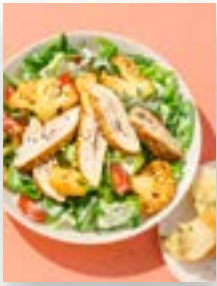
Salat mit Hähnchen, Seite 43