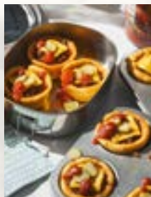
Cheeseburger-Muffins, Seite 38