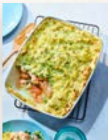
Lachs-Pie, Seite 34