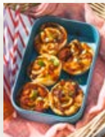
BBQ-Schnecken, Seite 40