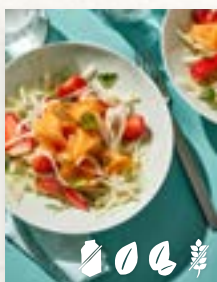
Kohlrabi-Erdbeer-Salat, Seite 17