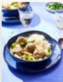
Königsberger Spargel, Seite 10