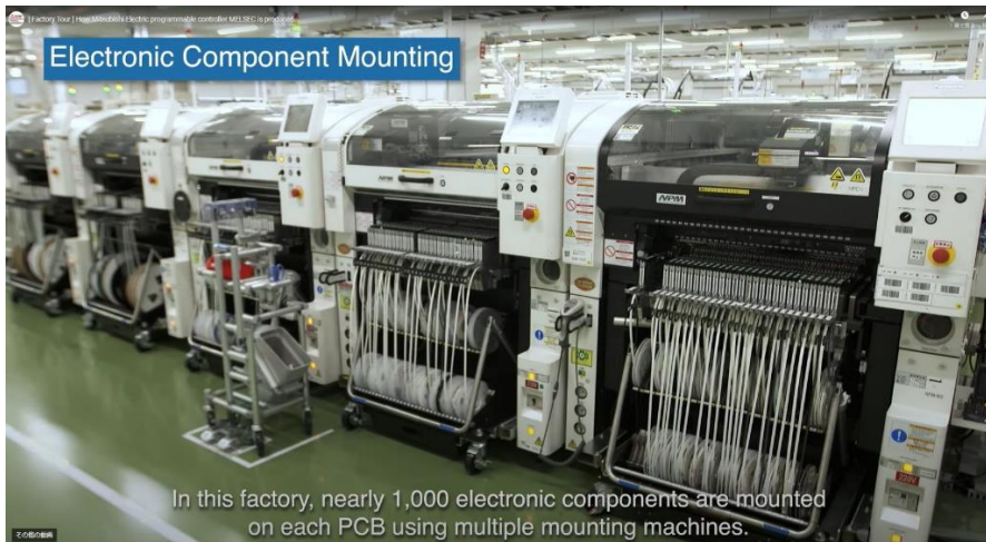
Bild 3: Die erste Tour zeigt, wie die Fabrikautomatisierungsprodukte im Werk Nagoya hergestellt werden.