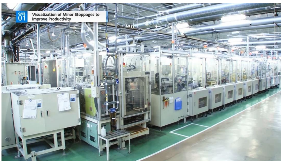
Bild 4: Bei der zweiten Werksbesichtigung werden die Produktionslinien im Fukuyama Works vorgestellt, die dank "e-F@ctory"-Konzept für eine digitale Fertigung stehen.