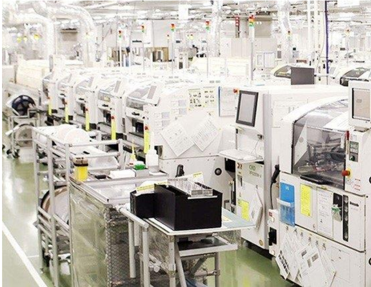
Bild 1: Die virtuelle Werkstour führt Sie durch die verschiedenen Technologien und Lösungen.