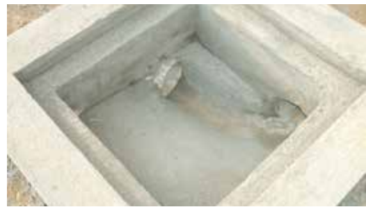
CAJA DOMICILIARIA De hormigón hecho in sitio.