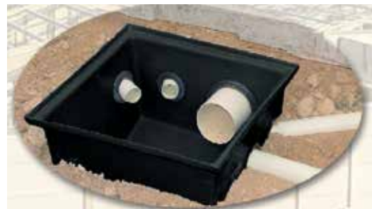
CAJA DOMICILIARIA PLASTIGAMA Proyecto Habitacional Mucho Lote