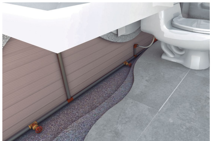
Diagrama de uso en viviendas