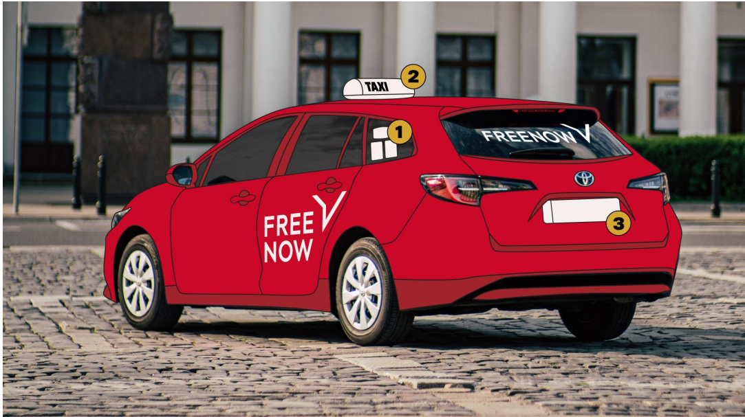
BIELSKO-BIAŁA, TRÓJMIASTO, BYDGOSZCZ