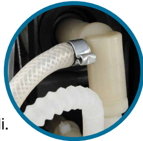
Pompa ve Dağıtıcı Arası