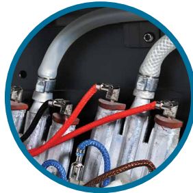
Dağıtıcı ve Isıtıcı Arası