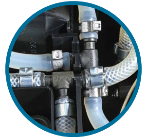
Isıtıcı ve Demleyici Arası