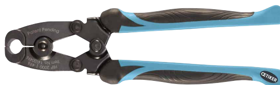
HIP 2000 | 496 – Szczęki standardowe, uchwyty proste