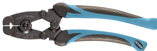
HIP 2000 | 499 – Szczęki boczne, uchwyty zakrzywione