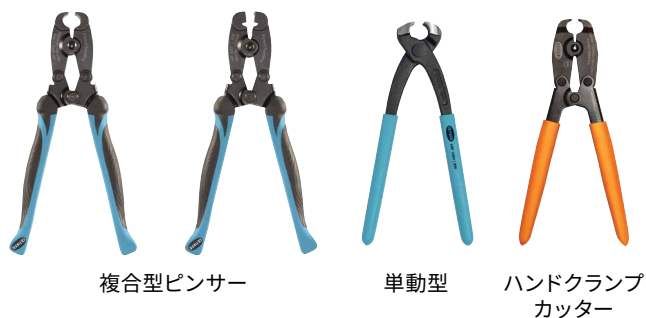
複合型ピンサマー