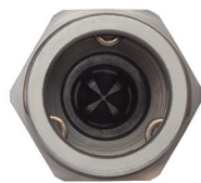
Vedação de membrana QC

Para mais informações, entre em contato com o representante local da Oetiker ou visite Oetiker.com .