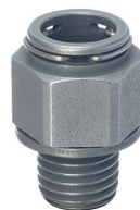
QC de aço com vedação colada

AEM (-40 °C ... 180 °C), resistência a óleo e graxa