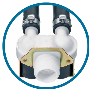
Entrada de agua