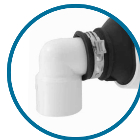
Tuyau de vidange