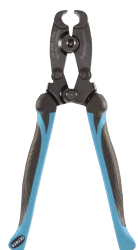
Pinces à mouvement composé