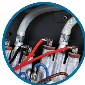
분배기와 히터 사이