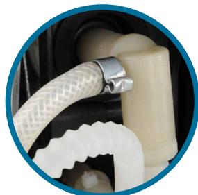
펌프와 분배기 사이