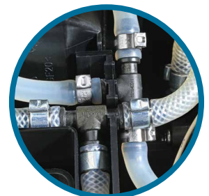
히터와 브루워 사이