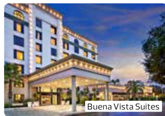
Buena Vista Suites