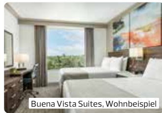
Buena Vista Suites, Wohnbeispiel