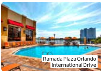
Ramada Plaza Orlando International Drive