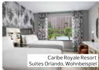
Caribe Royale Resort Suites Orlando, Wohnbeispiel