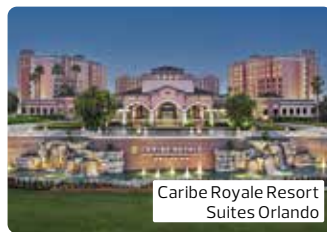
Caribe Royale Resort Suites Orlando