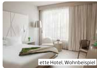
ette Hotel, Wohnbeispiel