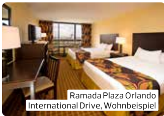
Ramada Plaza Orlando International Drive, Wohnbeispiel