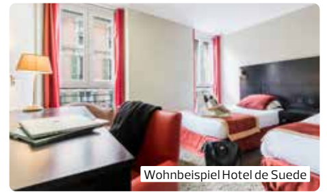
Wohnbeispiel Hotel de Suede