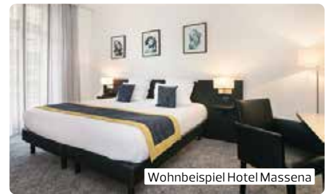
Wohnbeispiel Hotel Massena