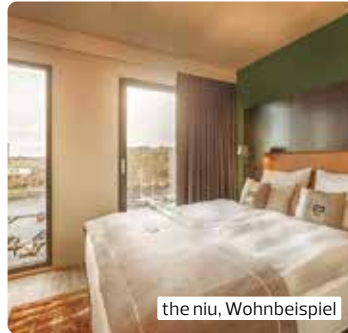
the niu, Wohnbeispiel