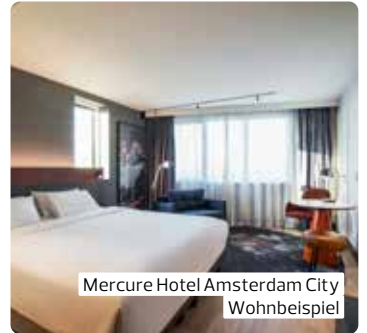
Mercure Hotel Amsterdam City Wohnbeispiel