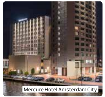
Mercure Hotel Amsterdam City