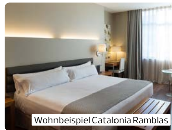
Wohnbeispiel Catalonia Ramblas