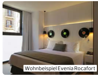
Wohnbeispiel Evenia Rocafort