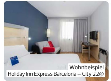
Wohnbeispiel Holiday Inn Express Barcelona – City 22@