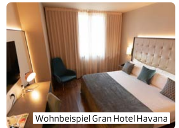
Wohnbeispiel Gran Hotel Havana