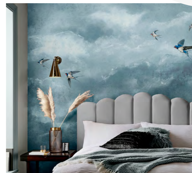
FLIGHTS OF SWALLOWS DIGITAAL BEHANG OP MAAT gezien bij WONEN.NL