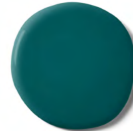
TASMANIA VERF gezien bij LE JOURNAL LA MAISON

We zijn beroemd! Wij laten ons graag inspireren door de verschillende kleuren en prachtige beelden tijdens het doorbladeren van de beste interieurmagazines. Waar wij het meest enthousiast van worden zijn natuurlijk de ontwerpen en kleuren uit onze collectie, ontworpen in onze eigen designstudio.