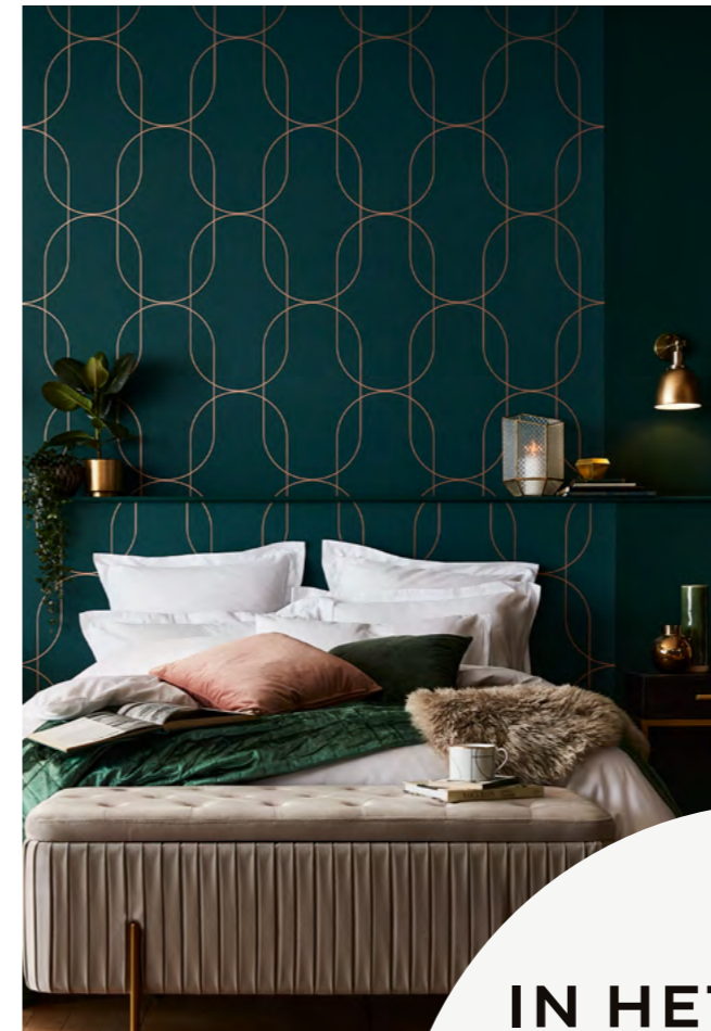
PALAIS GREEN BEHANG gezien bij AD PRO