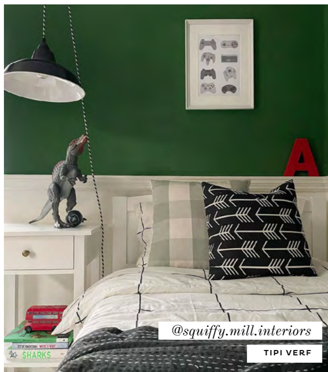
@squiffy.mill.interiors TIPI VERF

Tag ons, plaats en review en word deel van onze Loving Home familie.