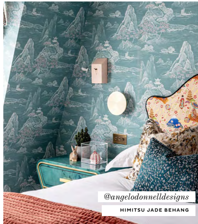
@angelodonnellidesigns HIMITSU JADE BEHANG