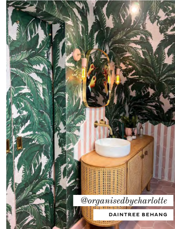
@organisedbycharlotte DAINTREE BEHANG