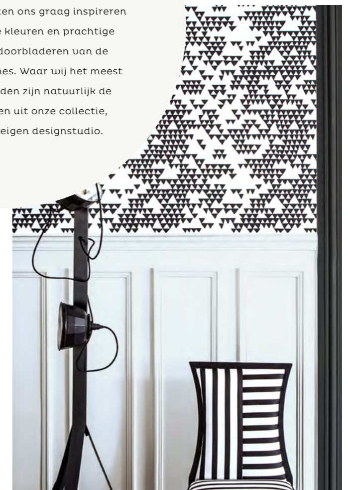
SECRET MOUNTAIN BLACK & WHITE gezien bij ELLE DECORATION