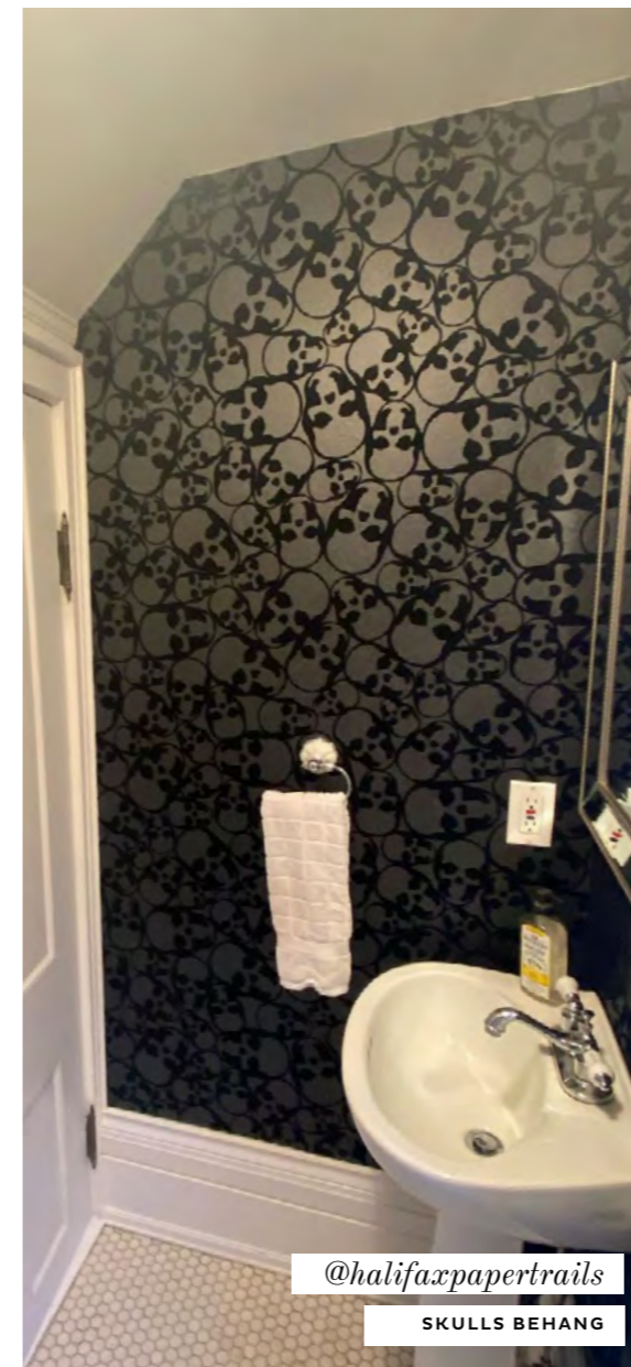
@halifaxpapertrails SKULLS BEHANG