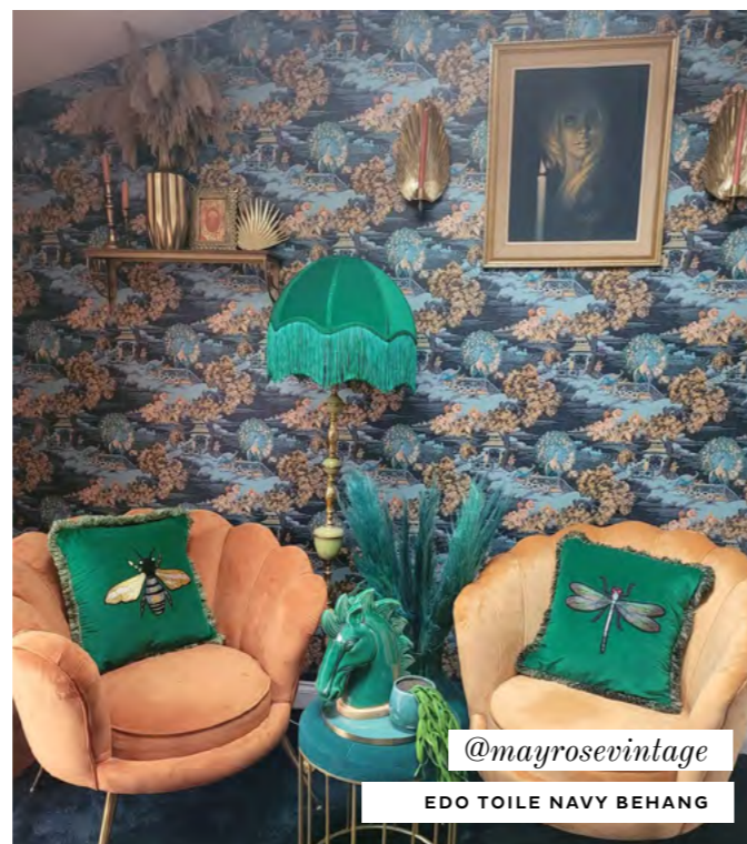
@mayrosevintage EDO TOILE NAVY BEHANG