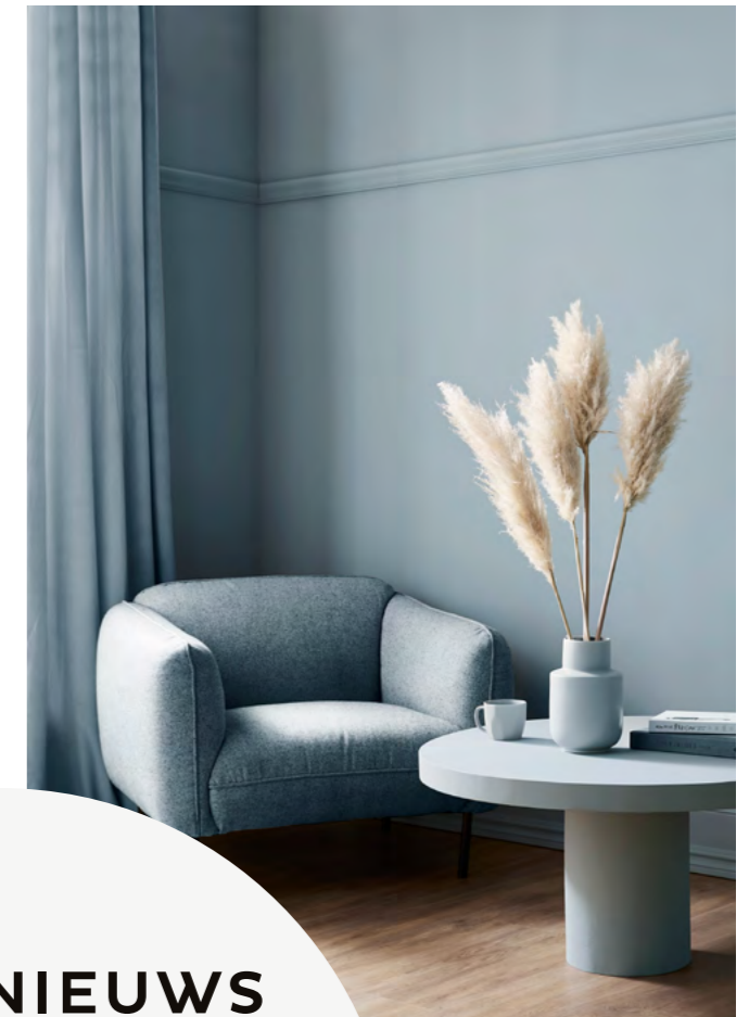
BREATHE VERF gezien bij HOUSE BEAUTIFUL