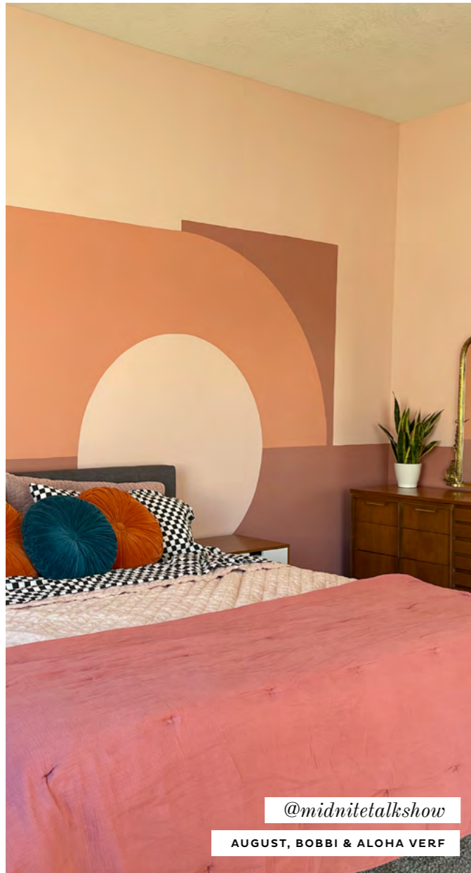
@midnitetalkshow AUGUST, BOBBI & ALOHA VERF