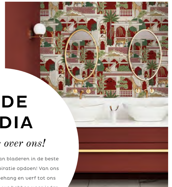
ANIMAHAL ALIZARIN BEHANG COTEMAISON.FR