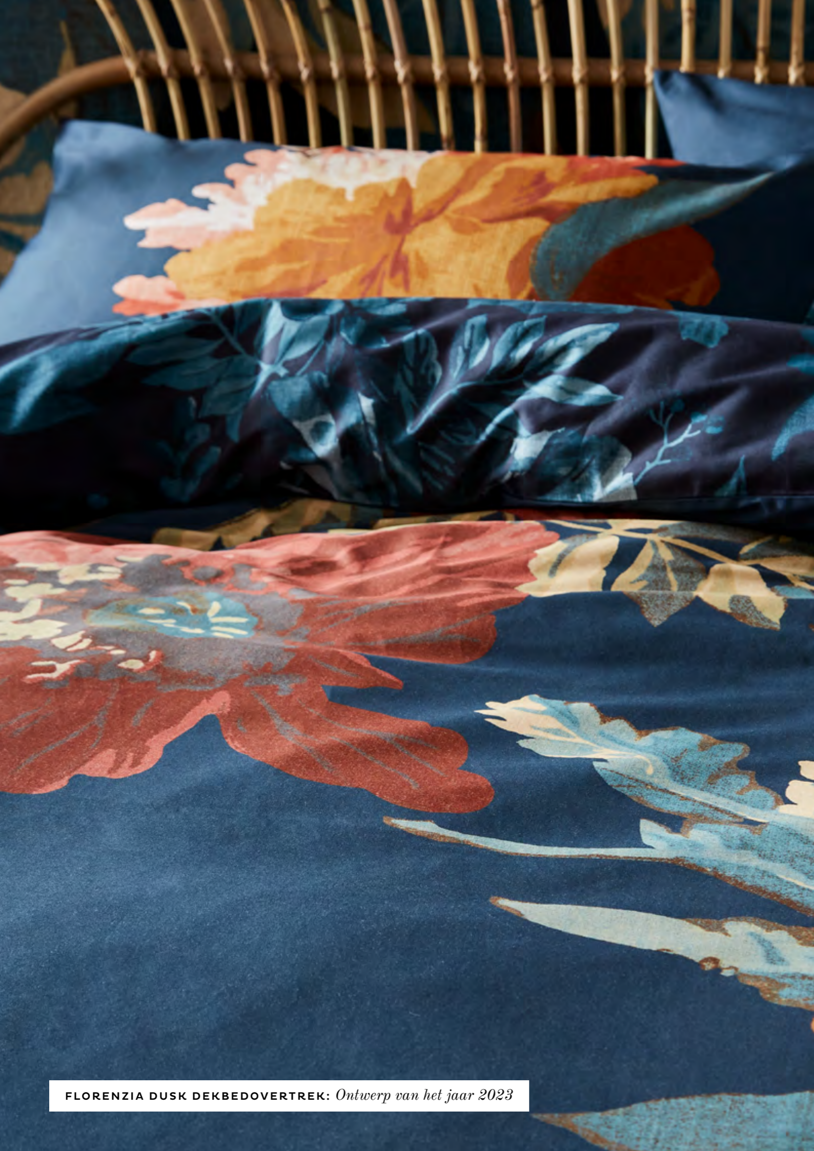
FLORENZIA DUSK DEKBEDOVERTREK: Ontwerp van het jaar 2023