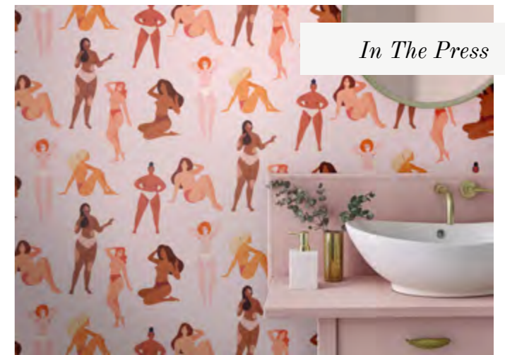
In The Press