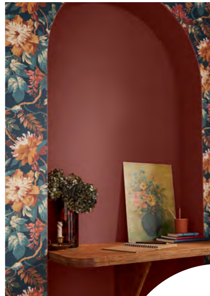
FLORENZIA DUSK BEHANG HOUSE BEAUTIFUL