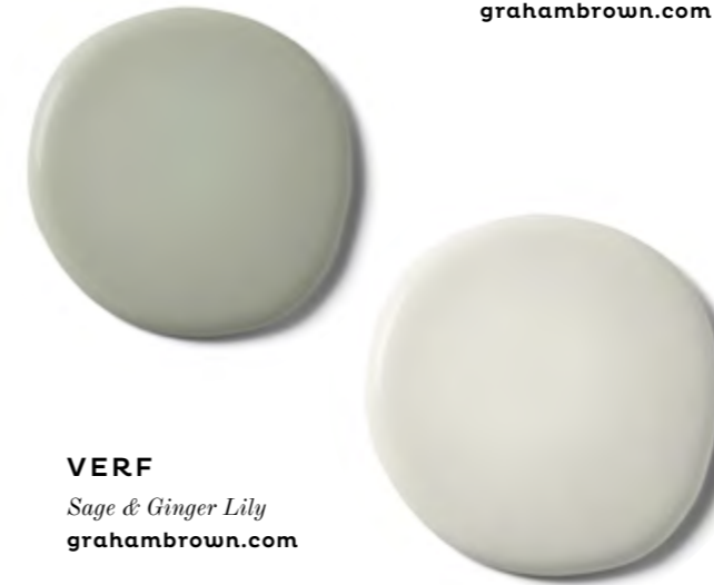
VERF Sage & Ginger Lily grahambrown.com