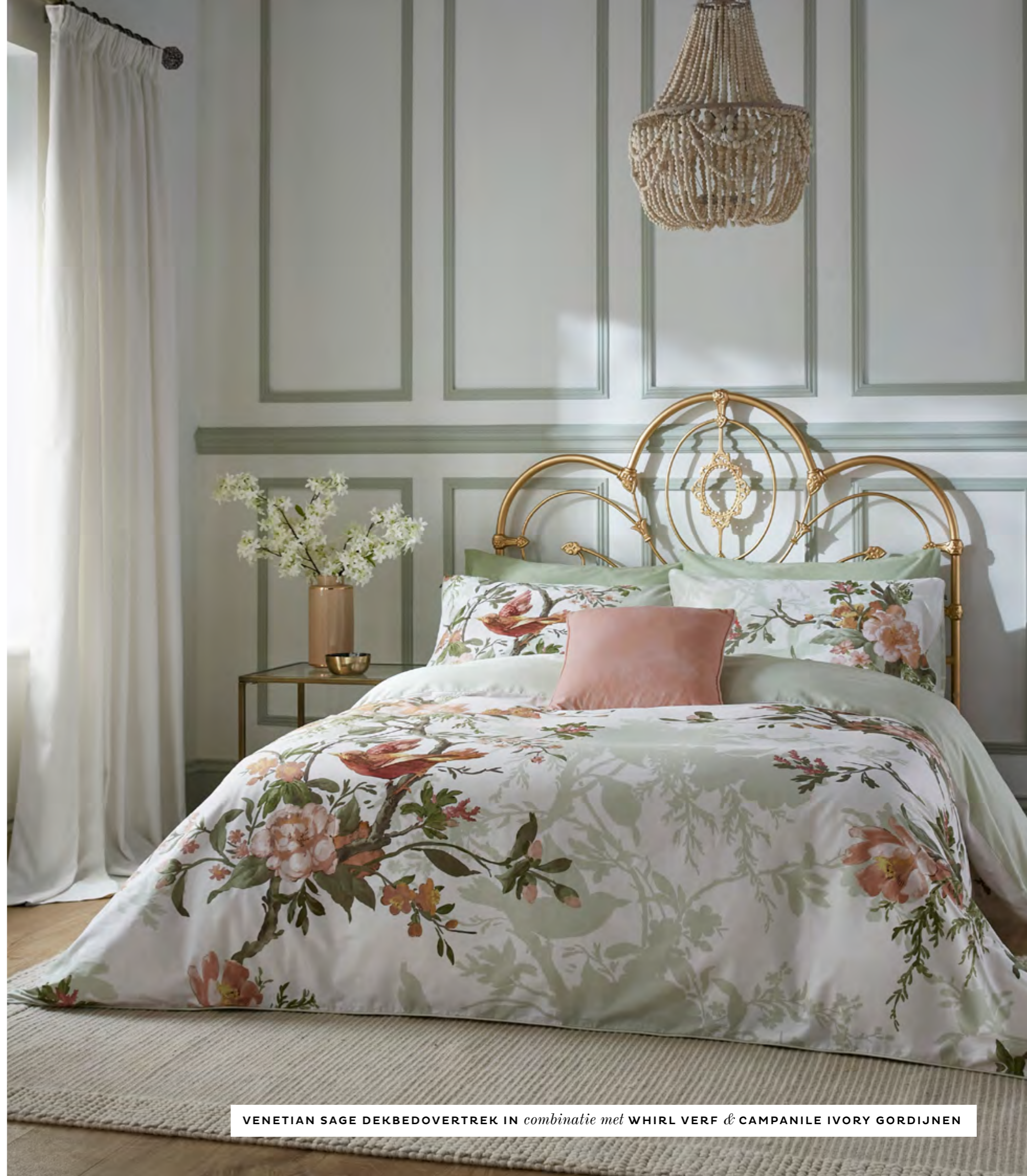
VENETIAN SAGE DEKBEDOVERTREK IN combinatie met WHIRL VERF & CAMPANILE IVORY GORDIJNEN

Voor degenen onder ons die familie en vrienden ontvangen is het eenvoudig om de logeerkamer een snelle opfrisbeurt geven met ons nieuwe assortiment luxe beddengoed. Met acht van onze beste ontwerpen om uit te kiezen kun je indruk maken op je gasten met minimale inspanning.