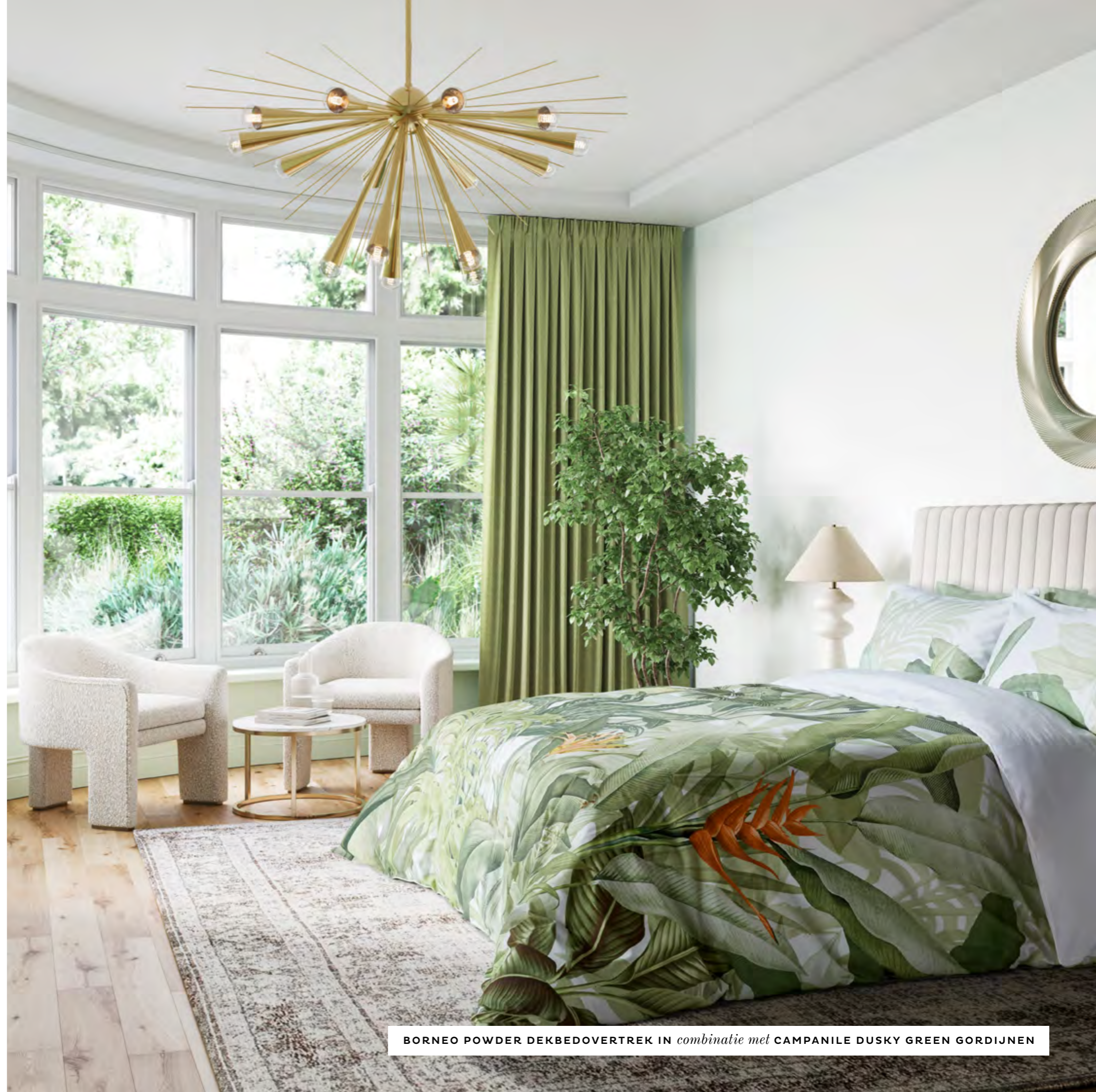
BORNEO POWDER DEKBEDOVERTREK IN combinatie met CAMPANILE DUSKY GREEN GORDIJNEN

Kies voor op maat gemaakte gordijnen of jaloezieën om de ruimtes in huis een extra mooi effect te geven. Er is een flinke reeks van patronen en texturen om uit te kiezen, die allemaal perfect passen bij de overige producten in ons assortiment.