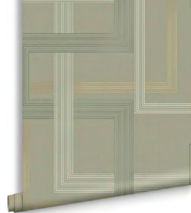
BEHANG Entwine Sage grahambrown.com