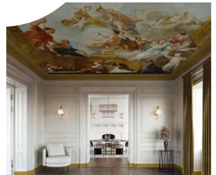
SLETER A REPRESENTATION OF THE LIBERAL ARTS BESPOKE MURAL ELEGANCE