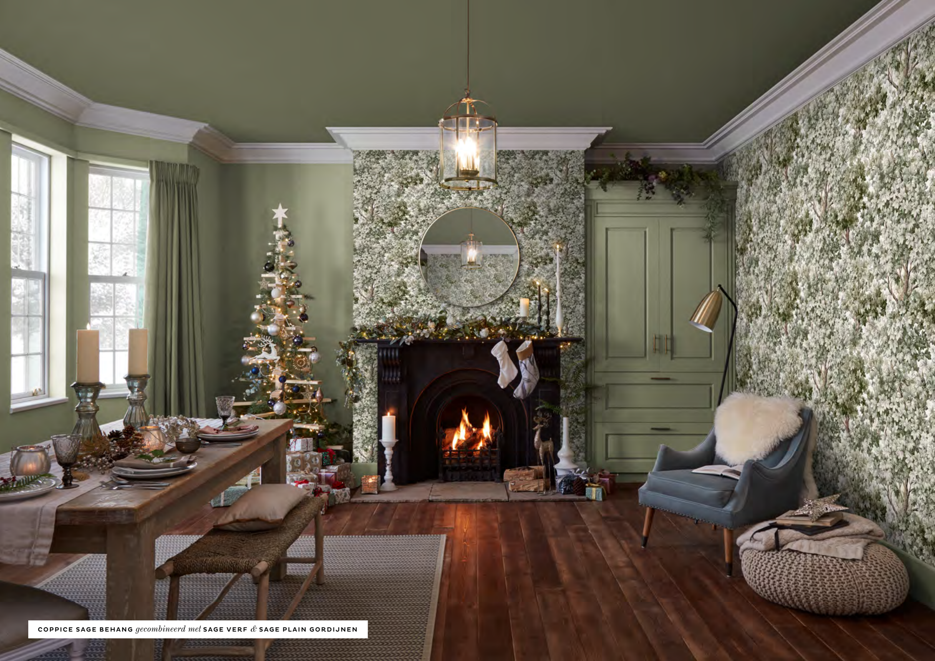
COPPICE SAGE BEHANG gecombineerd met SAGE VERF & SAGE PLAIN GORDIJNEN