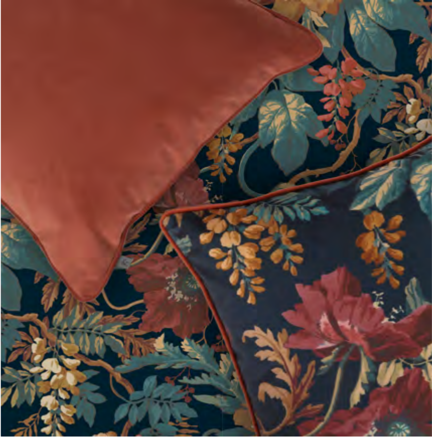
ALIZARIN OPULENCE KUSSEN & FLORENZIA DUSK KUSSEN

Ga voor een feestelijk bloemenpatroon zoals ons ontwerp van het jaar 2023: Florenzia, en creëer een gezellig gevoel. Ga je liever voor een frisse en chique look? Probeer dan ons elegante Venetian Sage ontwerp.