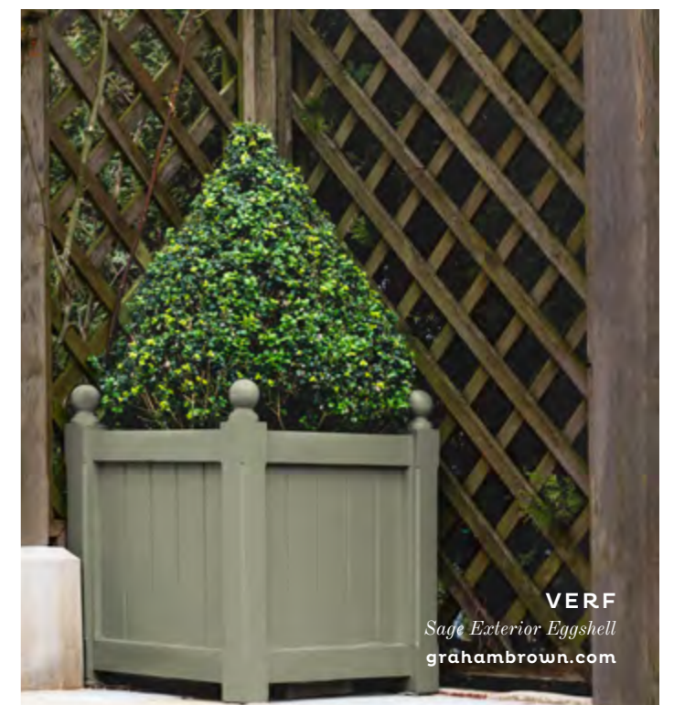
VERF Sage Exterior Eggshell grahambrown.com