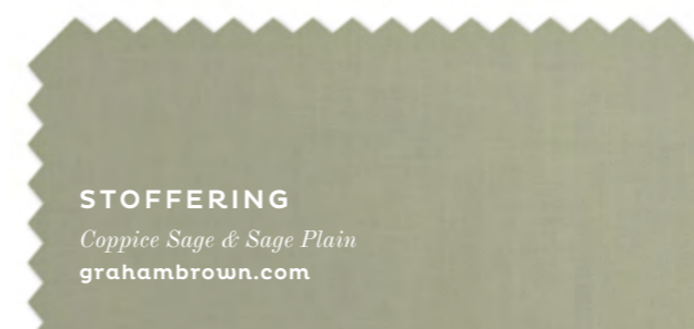
STOFFERING Coppice Sage & Sage Plain grahambrown.com