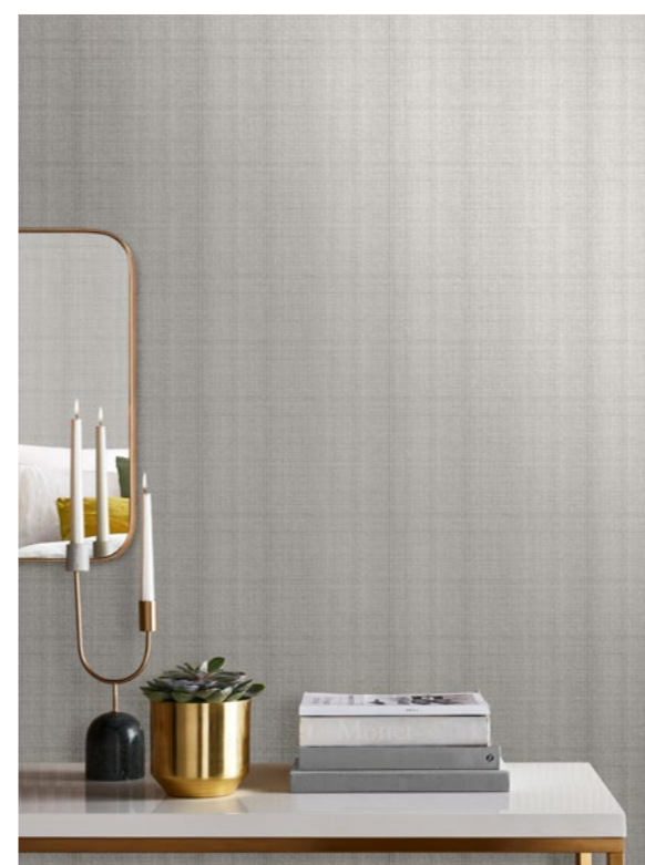
BEHANG Haze Natural grahambrown.com

Warm Mittens is de perfecte greige tint om een comfortabele en uitnodigende ruimte te creëren. Gebruik de kleur alleen om een knus cocoon-effect te creëren of creëer een kenmerkende muur naast de warmwitte tint Glass Heart.