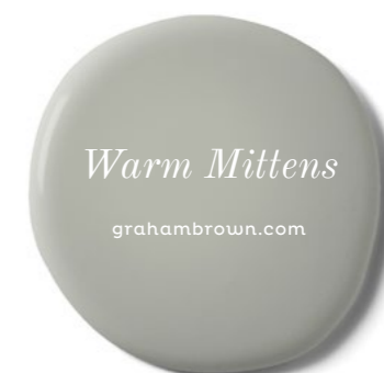
Warm Mittens grahambrown.com