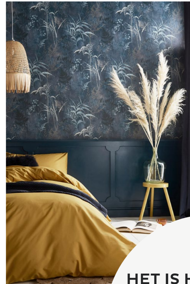
Restore Midnight behang gezien in THE SPRUCE US