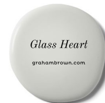
Glass Heart grahambrown.com

Is de perfecte mix tussen grijs en neutraal en houd je deze kerst gezellig.