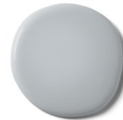
Luxe ( Exterior Eggshell ) gezien in MODERN GARDENS

Heb je deze patronen en kleuren uit ons assortiment gespot?