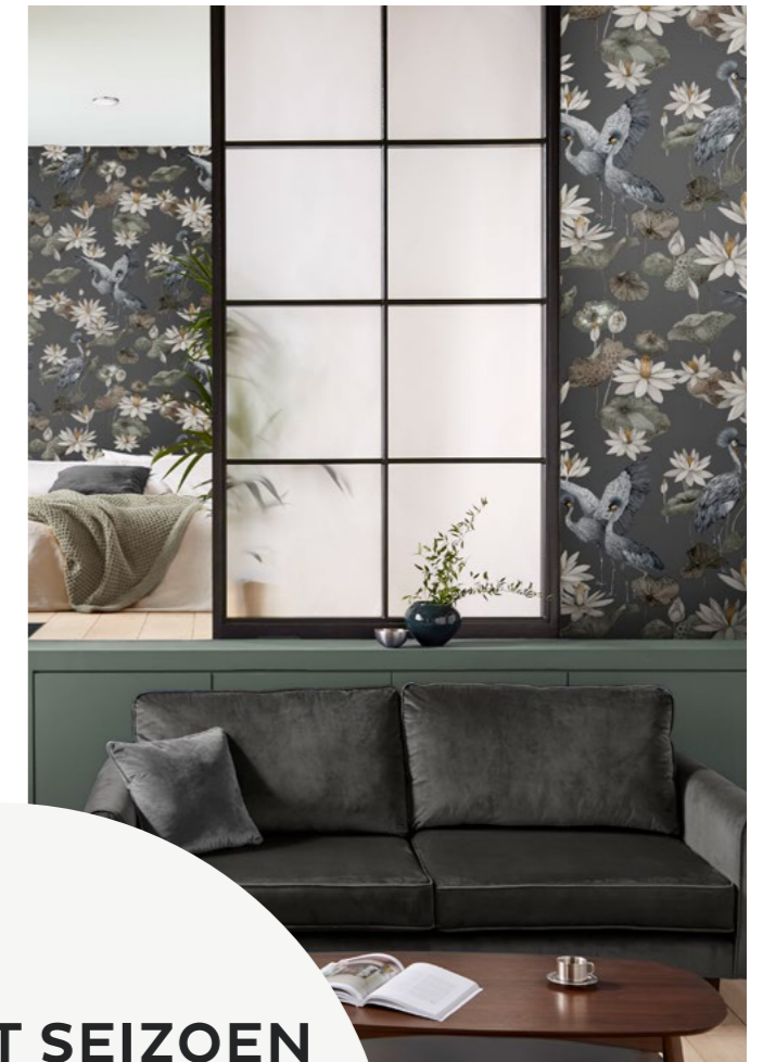
Teien Slate Grey behang gezien in REAL HOMES