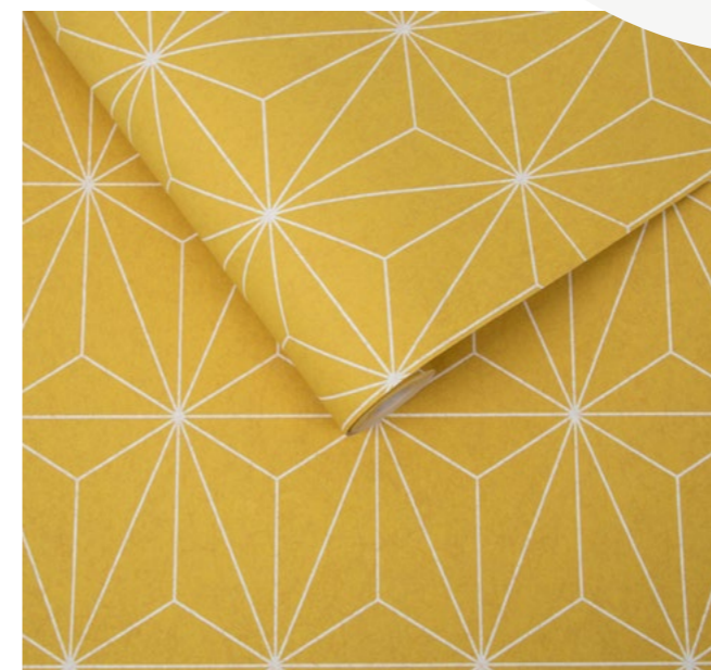
Prism Yellow Wallpaper