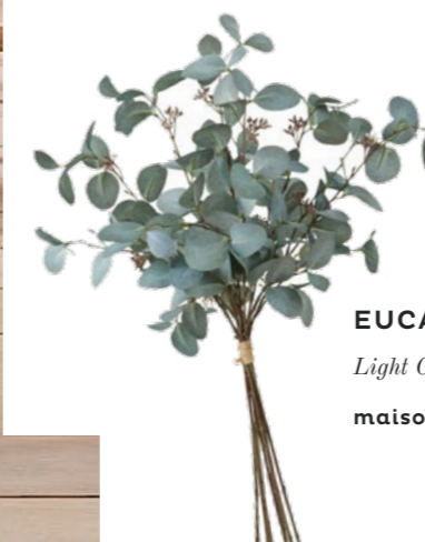
EUCALYPTUS TAK Light Green Artificial maisonsdumonde.com