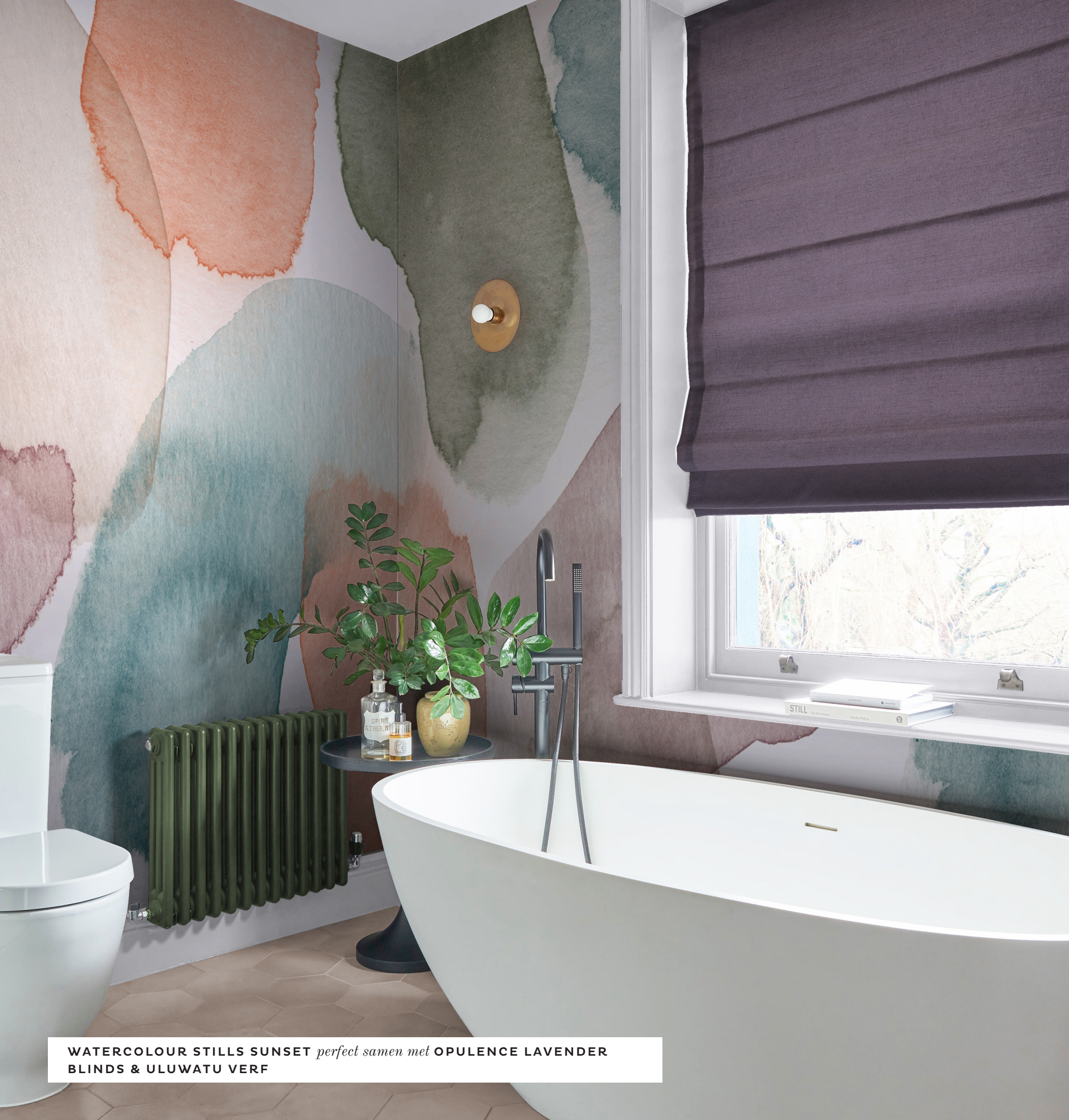
WATERCOLOUR STILLS SUNSET perfect samen met OPULENCE LAVENDER BLINDS & ULUWATU VERF

N u we de seizoenen beginnen te veranderen, de koele temperaturen van de winter achter ons laten en het natuurlijke landschap gevuld is met schaarse boomtakken zonder bladeren, knisperend ijsig gras en donkere lege luchten, gaan we de lente in. Het seizoen waarin gebladerte en groen beginnen te bloeien.