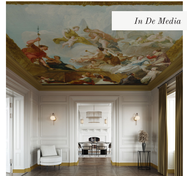
In De Media