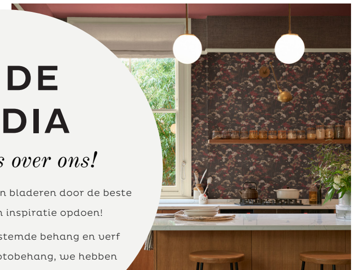
FLOWER PRESS GLASTONBURY BEHANG PA MEDIA (UK)