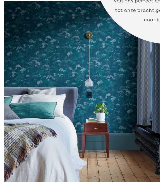
FLOWER PRESS DENIM BEHANG VT WONEN (NEDERLAND)