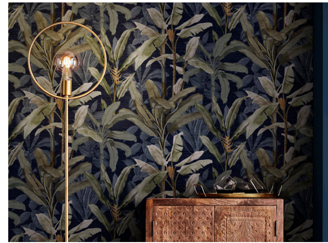
BORNEO MIDNIGHT BEHANG LIBELLE LIVING (NEDERLAND)