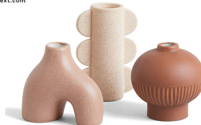
VAZEN Set of 3 Shaped Ceramic Mini Textured Vases next.com