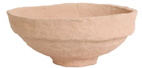
KERAMIEKEN SCHAAL Light & Living Deco Dish olivias.com