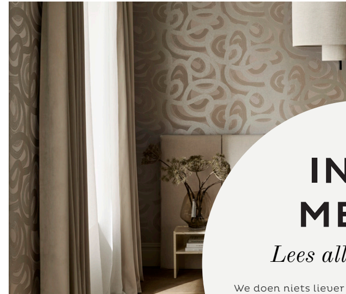
AMBIRE NEUTRAL BEHANG IDEAL HOME (UK)