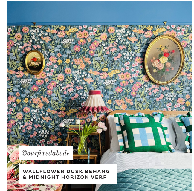
@ourfixedabode WALLFLOWER DUSK BEHANG & MIDNIGHT HORIZON VERF