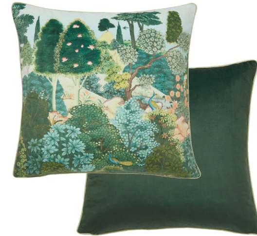
KUSSEN New Eden grahambrown.com