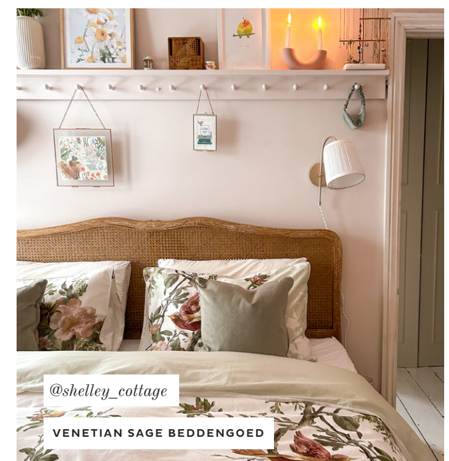
@shelley_cottage VENETIAN SAGE BEDDINGEOD