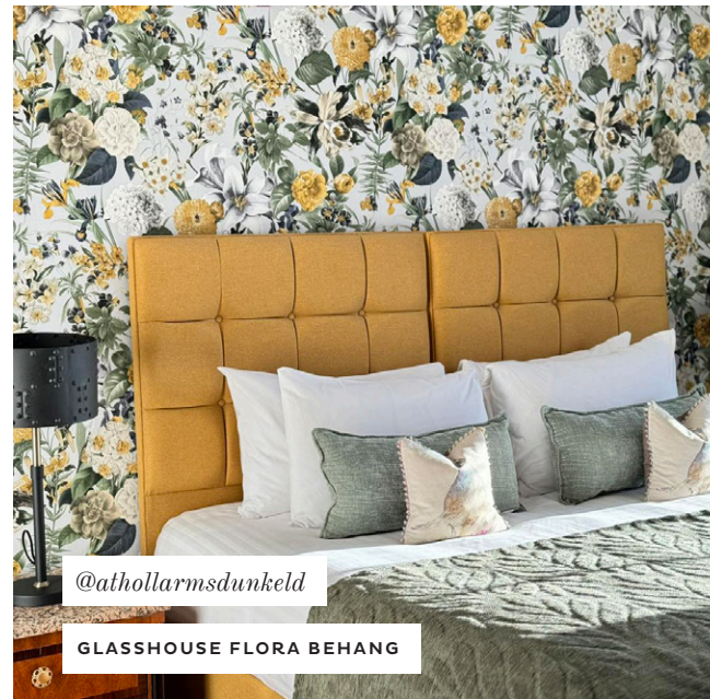
@athollarmsdunkeld GLASSHOUSE FLORA BEHANG

OPEN DE SPOTIFY APP EN TIK OP ZOEKEN, TIK OP HET CAMERA ICOON EN SCAN DE CODE HIERBOVEN