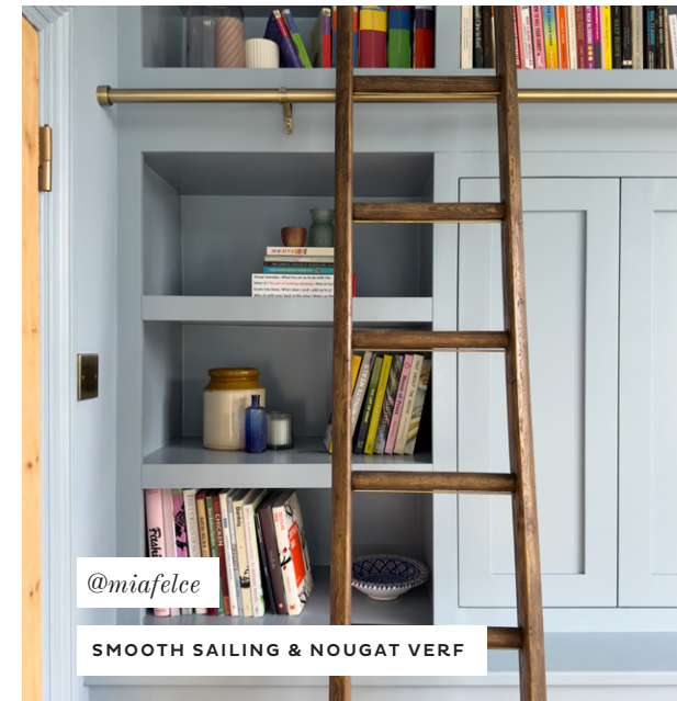
@miafelce SMOOTH SAILING & NOUGAT VERF