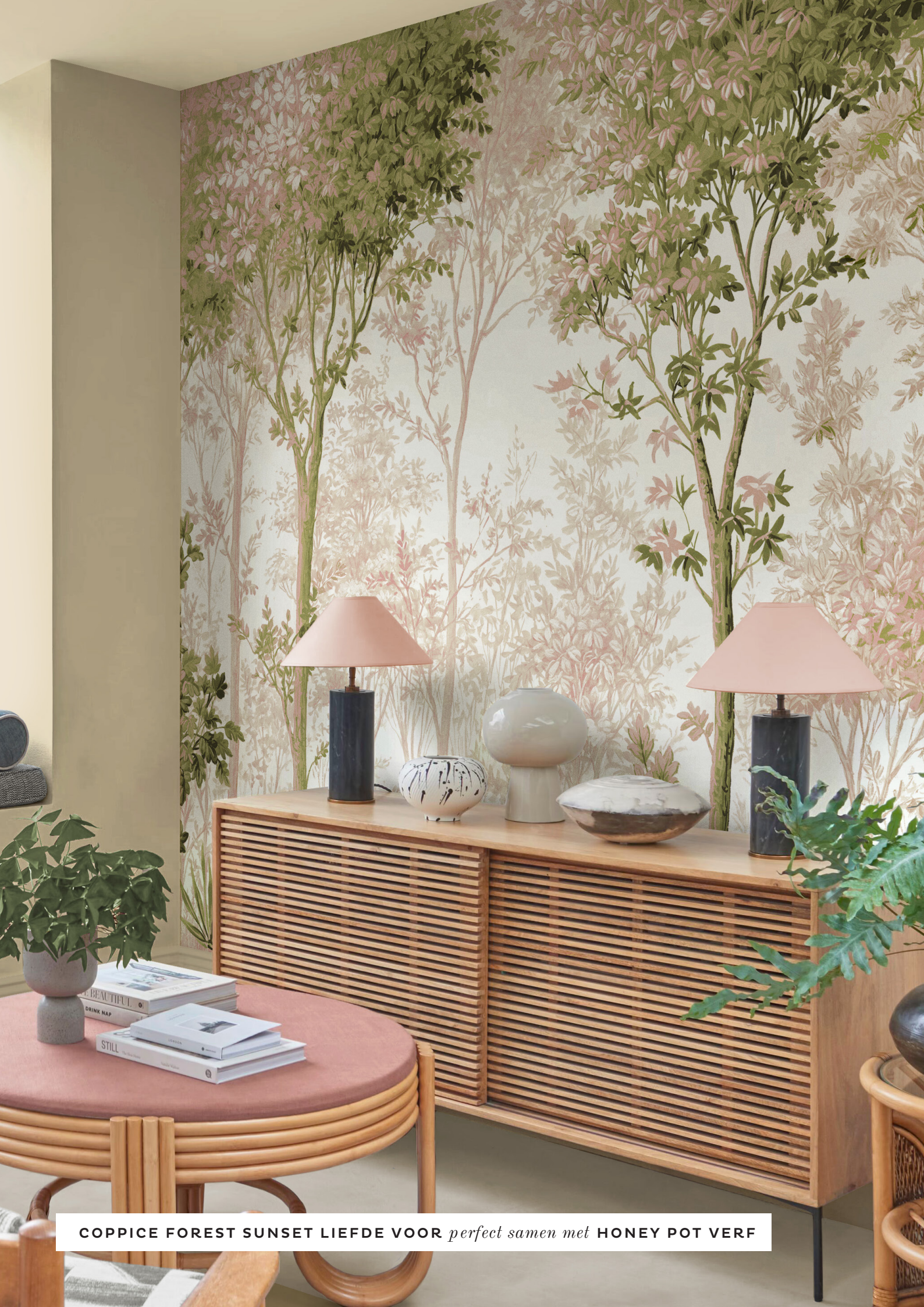
COPPICE FOREST SUNSET LIEFDE VOOR perfect samen met HONEY POT VERF