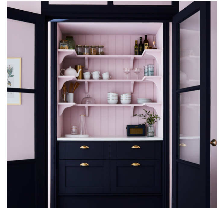
ELLIE & TROUBLE MATT EMULSION