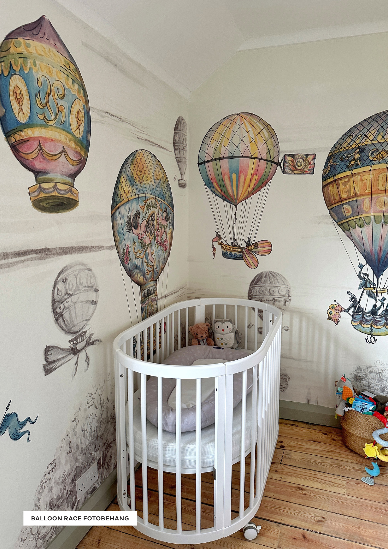
BALLOON RACE FOTOBEBANG