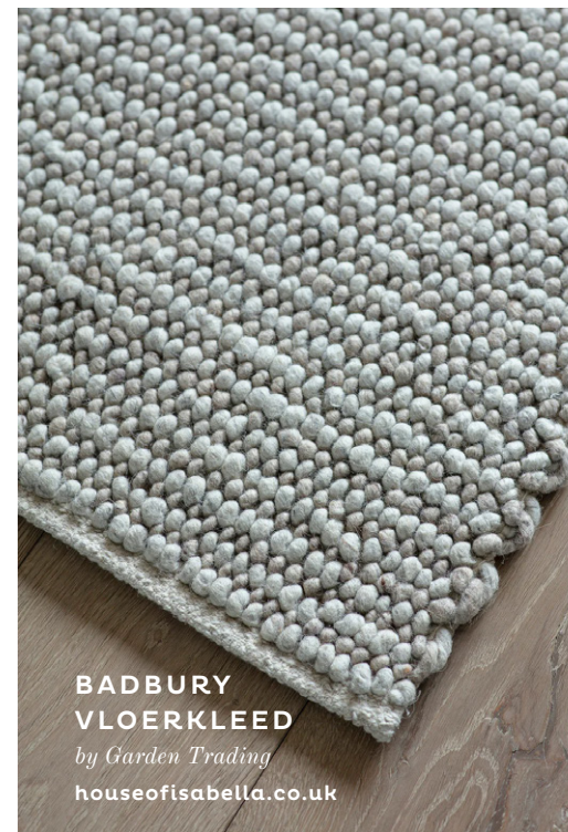
BADBURY VLOERKLEED by Garden Trading houseofisabella.co.uk