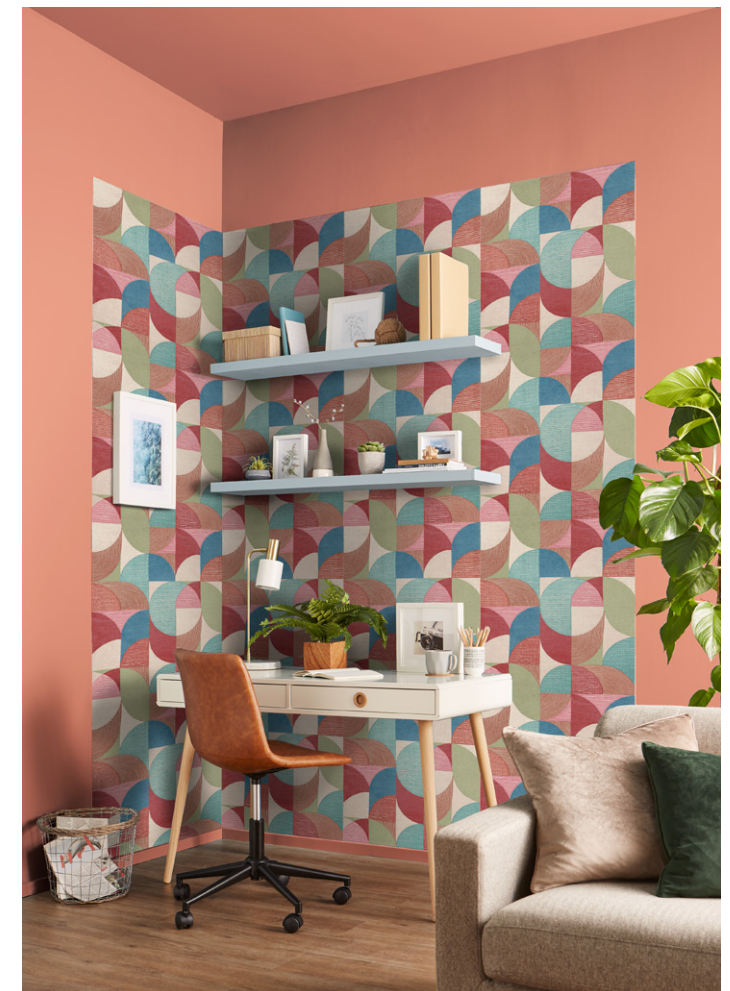
STITCH CRAZE CARNIVAL & ALOHA MATT EMULSION