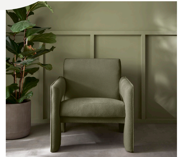
VIRIDIS VERF WALL STREET JOURNAL (US)

IN DE MEDIA Lees alles over ons! We doen niets liever dan bladeren door de beste interieurbladen en inspiratie opdoen! Van ons perfect afgestemde behang en verf tot onze prachtige fotobehang, we hebben voor ieder wat wils!