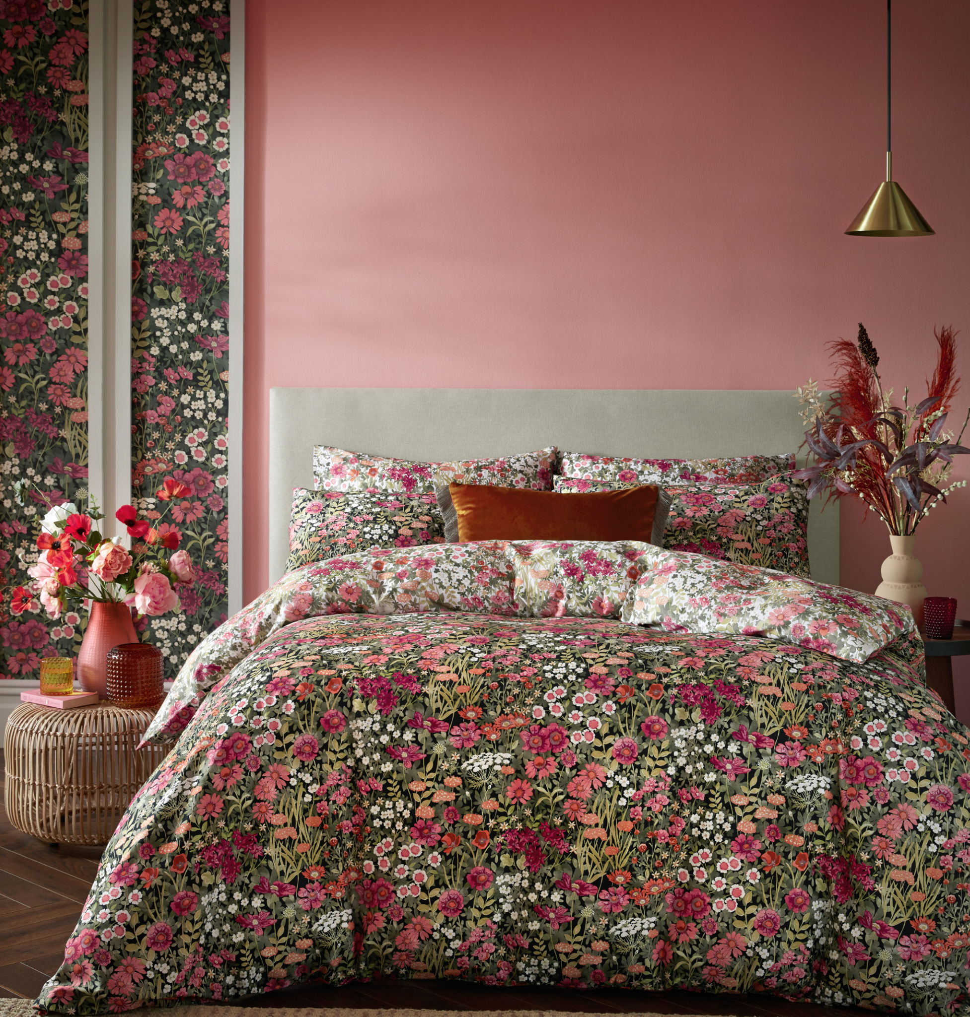
WALLFLOWER NIGHT GARDEN BLACK BEDDENGOED