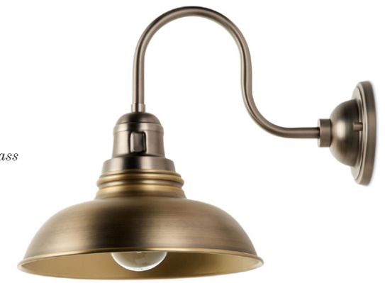
WANDLAMP Millhouse Antique Brass johnlewis.com