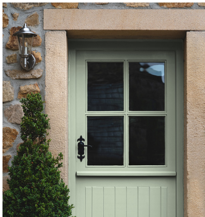
SANTORINI EXTERIOR EGGSHELL