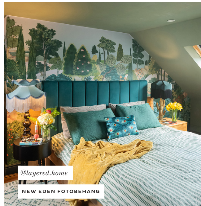
@layered.home NEW EDEN FOTOBEBANG