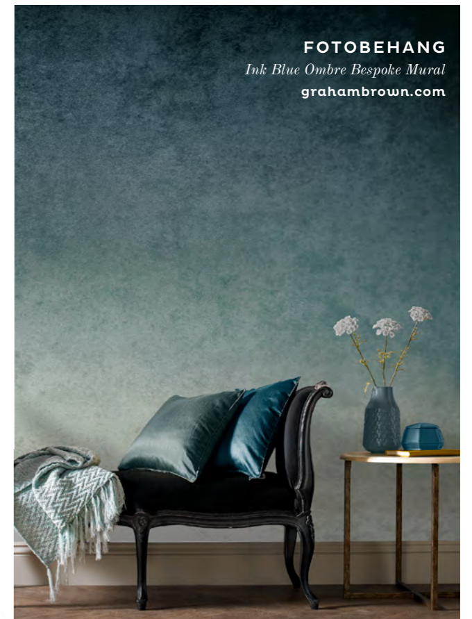
FOTOBEHANG Ink Blue Ombre Bespoke Mural grahambrown.com