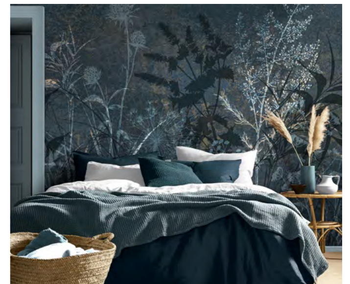
RESTORE MIDNIGHT FOTOBEBANG OP MAAT GEMAAKT HOSPITALITY DESIGN US