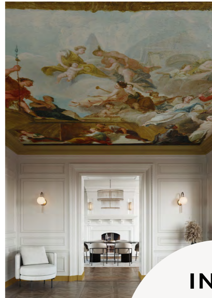
A REPRESENTATION OF THE LIBERAL ARTS FOTOBEBANG OP MAAT GEMAAKT HOMES AND GARDEN