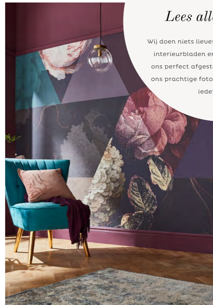
TIMEPIECE AMETHYST FOTOBEBANG OP MAAT GEMAAKT REAL HOMES

IN DE MEDIA Lees alles over ons! Wij doen niets liever dan bladeren in de beste interieurbladen en inspiratie opdoen! Van ons perfect afgestemde behang en verf tot ons prachtige fotobehang, we hebben voor ieder wat wils!