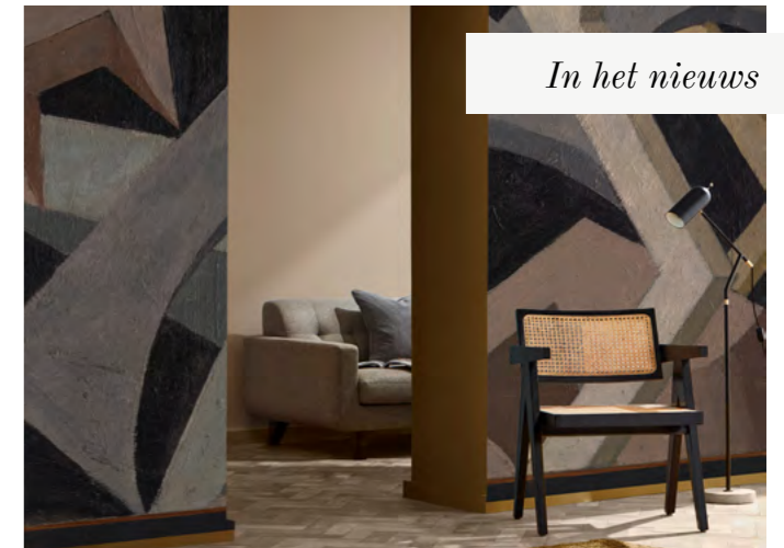
In het nieuws