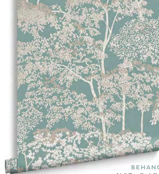
BEHANG Idyll Tree Duck Egg grahambrown.com