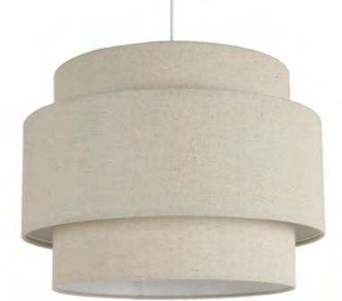
LAMPENKAP Triple Layer marksandspencer.com

Het ontwerp is subtiel en verfijnd, met de afbeelding van een schilderachtige jungle scène in diepe en aardse tinten, wat een sereen gevoel van rust in elke kamer geeft.