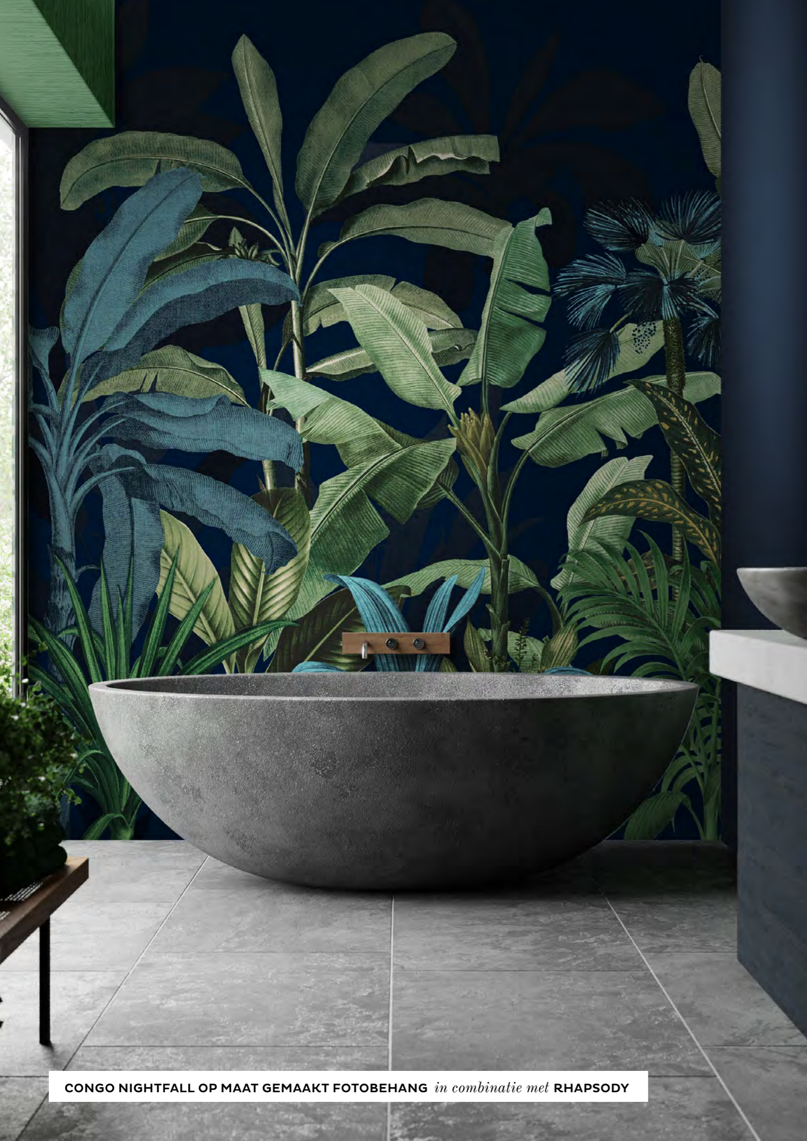
CONGO NIGHTFALL OP MAAT GEMAAKT FOTOBEBANG in combinatie met RHAPSODY