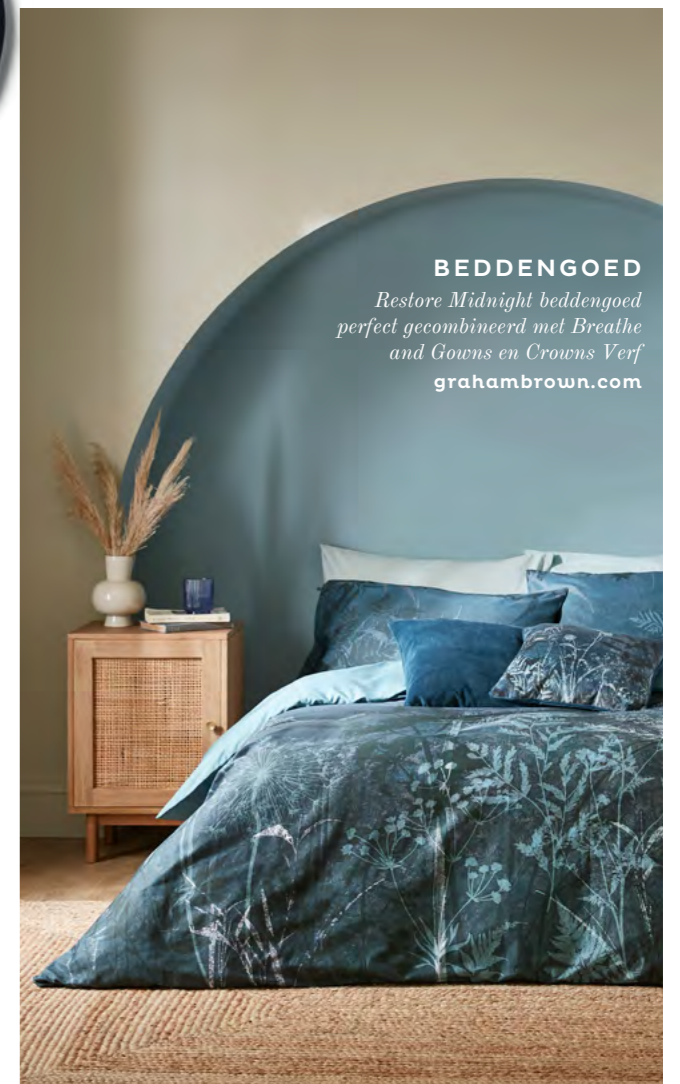
BEDDENGOED Restore Midnight beddengoed perfect gecombineerd met Breathe and Gowns en Crowns Verf grahambrown.com