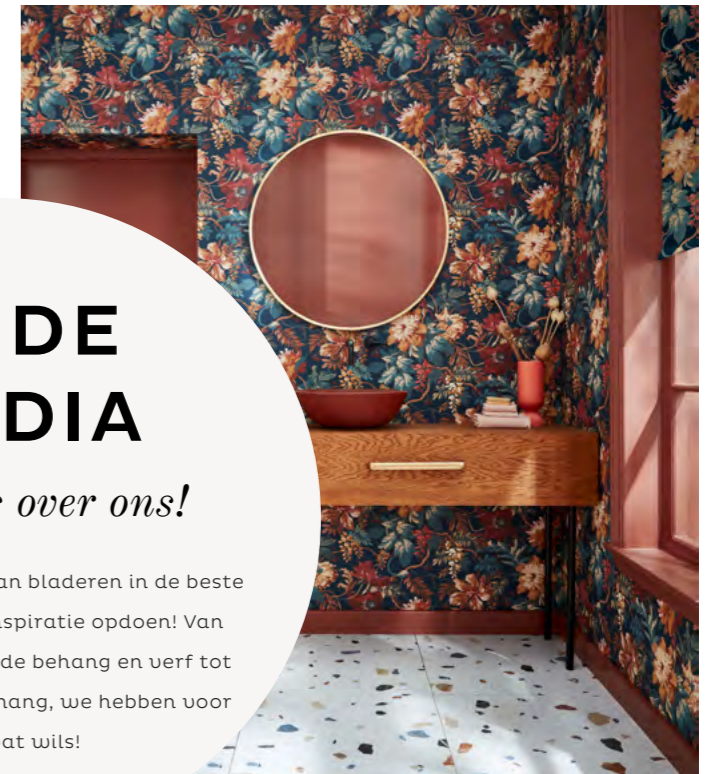
FLORENZIA DUSK BEHANG STYLIST.CO.UK

IN DE MEDIA Lees alles over ons! Wij doen niets liever dan bladeren in de beste interieurbladen en inspiratie opdoen! Van ons perfect afgestemde behang en verf tot ons prachtige fotobehang, we hebben voor ieder wat wils!