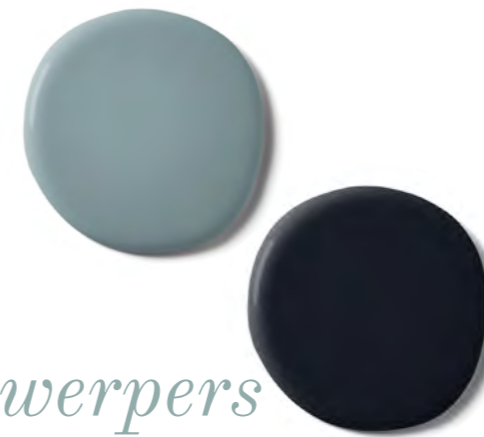
VERF Breathe and Trouble grahambrown.com