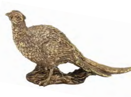
ORNAMENT Antique Gold Pheasant houseofisabella.co.uk

Het kan worden gebruikt als een statement in de woonkamer of slaapkamer, of als een opvallend element op het plafond.